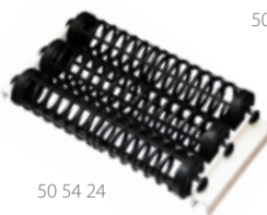
50 54 24