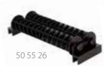
50 55 26