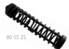
80 55 25