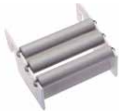
50 55 20