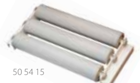
50 54 15