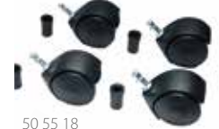
50 55 18