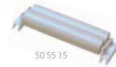
50 55 15