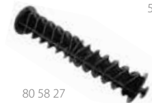
80 58 27