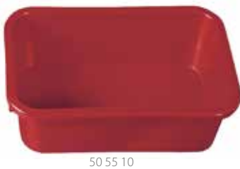
50 55 10

Konzipiert als Reinigungswanne zu unserem Rollenwaschset „Fliesenmeister“, jedoch auch als Mörtelkübel und durch die Eckenabrundungen als Mixerwanne hervorragend geeignet, 20 cm hoch, ca. 30 l Fassungsvermögen.