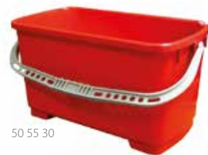
50 55 30