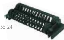
50 55 24