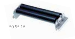
50 55 16