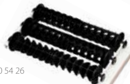
50 54 26