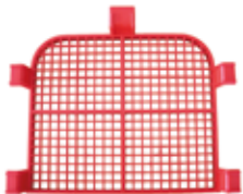
80 55 20