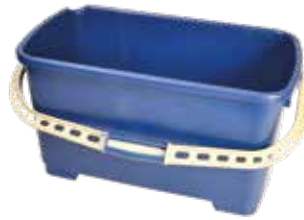
50 55 35