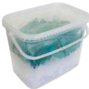
NIVELLIERSYSTEM CLASSIC SET 100 Laschen / 100 Keile / 1 Zange im Eimer