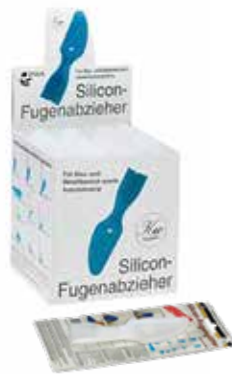
FUGENGLÄTTER MIT SCHAUFEL