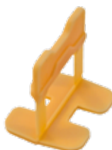
NIVELLIERSYSTEM LASCHEN 200 Stück/Beutel