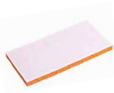
SCHWAMMGUMMI-AUFLAGE Mit Klett, ca. 20 mm stark