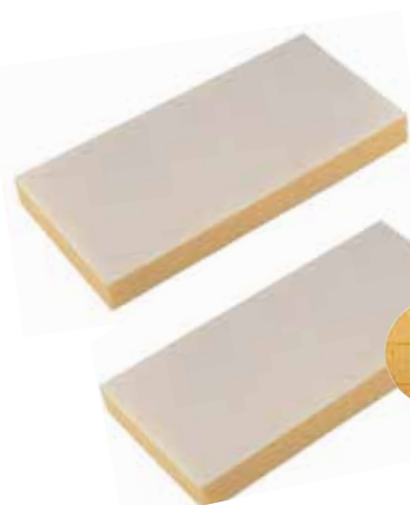
HYDRO-SCHWAMM-AUFLAGE Mit Klett, grobporiger Belag, gelb, ca. 30 mm stark