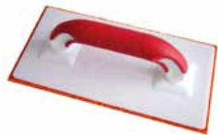
TOPLINE-BRETT MIT SCHWAMMGUMMI-AUFLAGE Ca. 20 mm stark