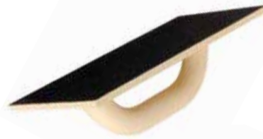
TRÄGERBRETT - PU Mit Klett