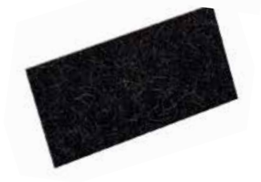
HARTFILZ-AUFLAGE Mit Klett, ca. 10 mm stark