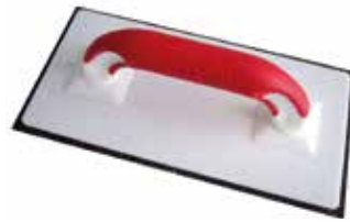
TOPLINE-BRETT MIT HARTFILZ-AUFLAGE Ca. 10 mm stark