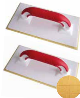
TOPLINE-BRETT MIT HYDRO-AUFLAGE Besonders aufnahmefähiger, grobporiger Belag, gelb, ca. 30 mm stark