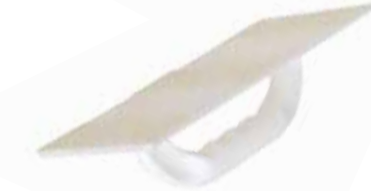
TRÄGERBRETT - TSG Mit Klett