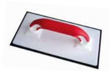
TOPLINE-BRETT MIT ZELLGUMMI-AUFLAGE Ca. 10 mm stark