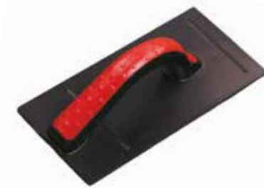
TRÄGERBRETT DESIGN LINE Mit Klett, ca. 5 mm stark