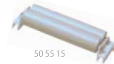
50 55 15