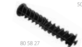
80 58 27