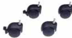
50 55 19