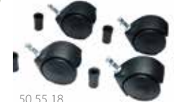
50 55 18