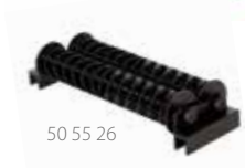
50 55 26