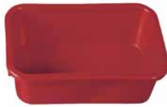
50 55 10

Konzipiert als Reinigungswanne zu unserem Rollenwaschset „Fliesenmeister“, jedoch auch als Mörtelkübel und durch die Eckenabrundungen als Mixerwanne hervorragend geeignet, 20 cm hoch, ca. 40 l Fassungsvermögen.