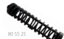
80 55 25