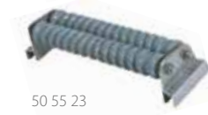
50 55 23