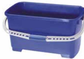
50 55 35