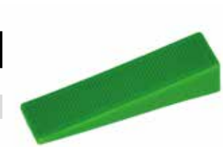
NIVELLIERSYSTEM KEILE 250 Stück / Beutel