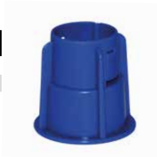
NIVELLIERSYSTEM DREHKNOPF 100 Stück / Beutel