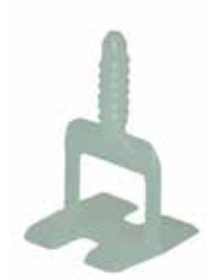
GEWINDELASCHEN 200 Gewindelaschen / Beutel